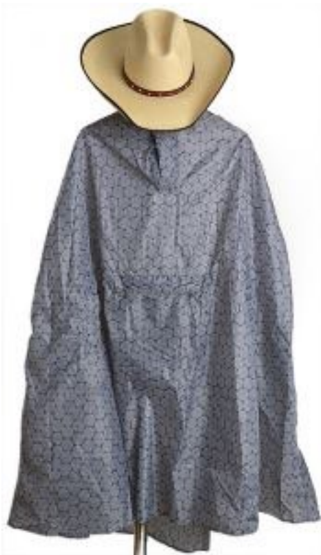
Assistentens klädesplagg i moment 7.3.