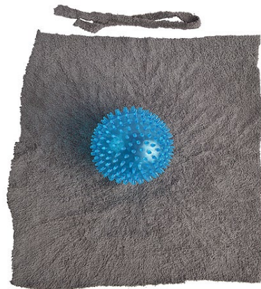
Pallon päällystäminen kankaalla osiossa 3. Pallo voi olla myös sileäpintainen.