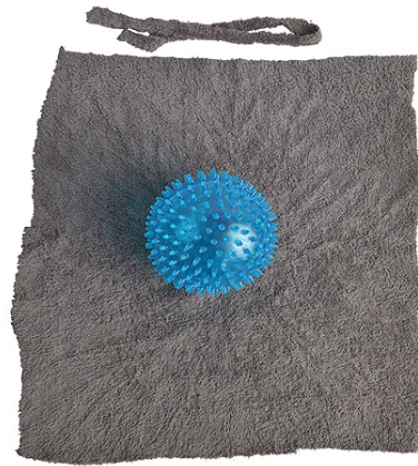
Pallon päällystäminen kankaalla osiossa 3. Pallo voi olla myös sileäpintainen.