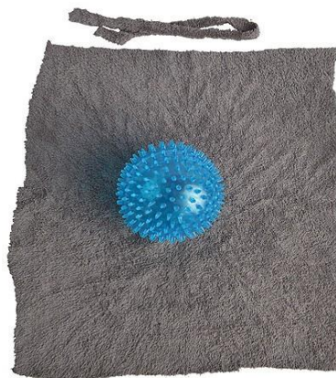
Bollen kläs över med tyg, moment 3 Bollen kan också vara slätytd.